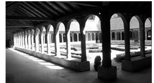
Abbaye de Montivilliers 76290 salle des fêtes Michel Vallery